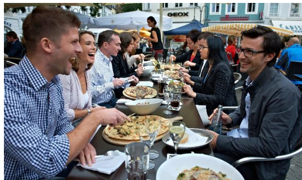
Flammkuchen in Saarbrücken

In Luxemburg, Metz, Saarbrücken und Trier kommen die Tafelfreuden zu Ehren, hier wird regionale Küche von fein bis rustikal geboten. Von den lothringischen Mirabellen über die kosmopolitische Küche Luxemburgs und den französischen Einfluss auf die Saarbrücker Menükarten bis zu den Weinbergen rund um Trier sind die Gaumenfreuden angesichts all dieser Geschmäcker und Spezialitäten vielfältig.