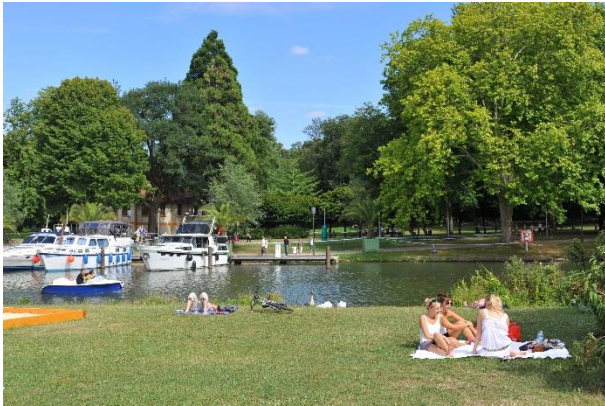
Plan d'eau in Metz

Ob an Saar, Mosel oder Alzette, immer kann man im Herzen der Stadt am Flussufer entlangspazieren. Bootsausflüge, Tretbootfahrten und Schippern auf den schwimmenden BBQ-Donuts sind nur einige der Wasserfreizeitaktivitäten, denen man sich an einem schönen Sommertag hingeben kann... und anschließend in den Gärten und auf den Grünflächen Entspannung finden.