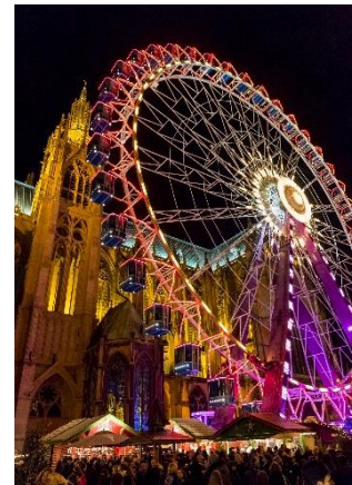
Riesenrad in Metz

Die Weihnachtsmärkte sind in allen vier Städten eine veritable Institution. Zwei Monate lang funkeln die Straßen, die Atmosphäre entspannt sich auf den großen Plätzen, wo die Besucher in den rund 455 Buden ihre weihnachtlichen Vorbereitungen treffen oder sich bei einem Becher Glühwein aufwärmen können. In Saarbrücken fliegt der Weihnachtsmann, in Metz lädt das Riesenrad, in Trier die Eislaufbahn, in Luxemburg das Lichterfest... Jede Stadt feiert Weihnachten mit so verschiedenartigen Veranstaltungen, dass man sich kaum für eine entscheiden kann! Es gibt vier Adventssonntage; gerade richtig für viermal Weihnachtsstimmung auf andere Weise!